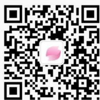
Wechat 公衆号 QRコード